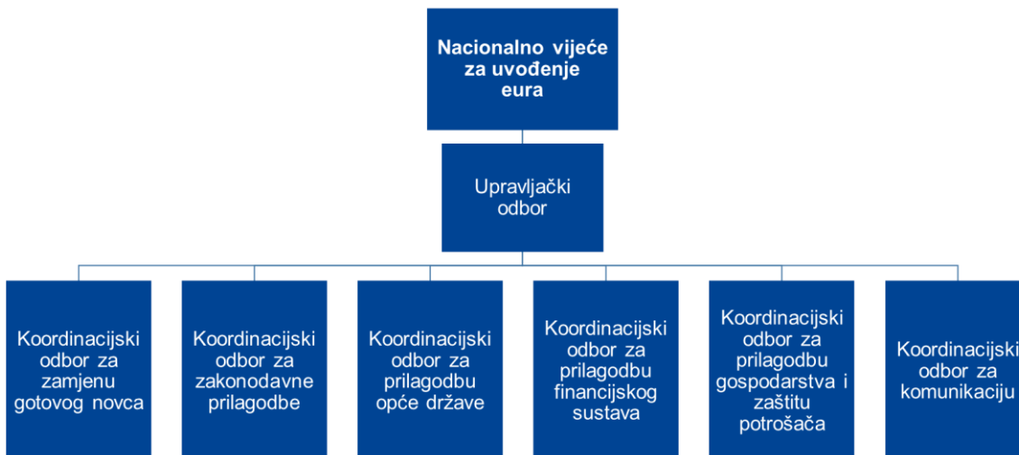
Slika 1. Koordinacijska tijela u postupku uvođenja eura